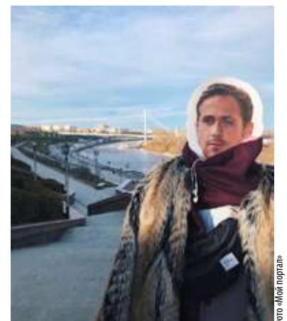
Фото «Мой город»