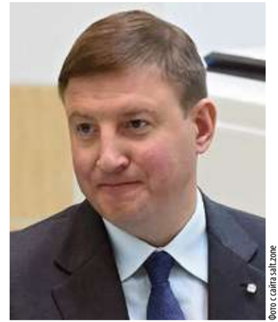
Андрей Турчак , секретарь генерального совета партии «Единая Россия»

«Мы не можем рассчитывать на понимание и поддержку граждан, если принимаемые решения не касаются нас самих. В этой связи считаю, что будет правильным, если депутаты и сенаторы внесут изменения в закон о статусе члена Совета Федерации и депутата Госдумы, устроят сложившееся неравенство и отменят себе преференции. Депутаты Госдумы и сенаторы должны получать пенсию в общем, едином для всех граждан России порядке».