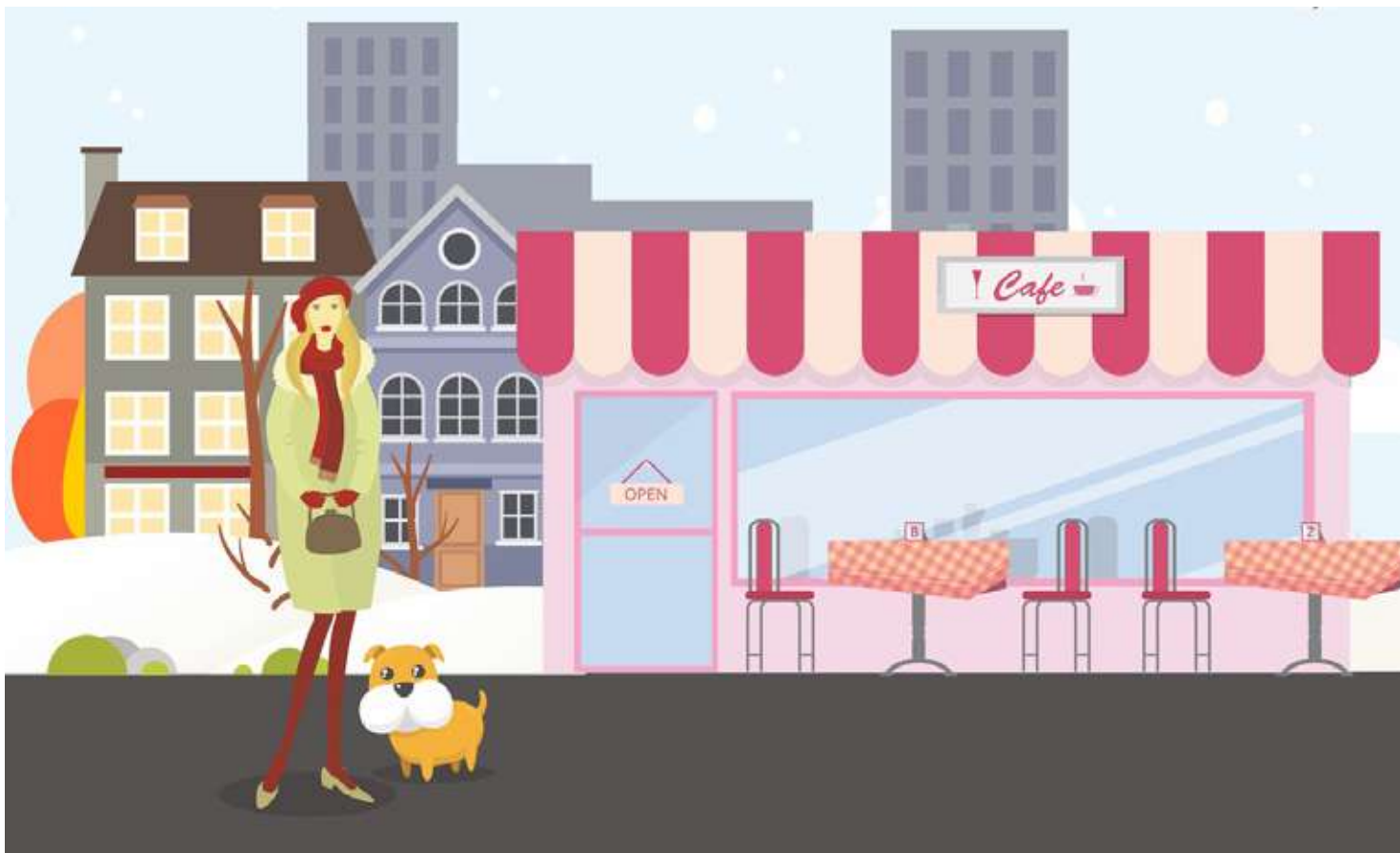
Иллюстрация Ольги Дмитриевой