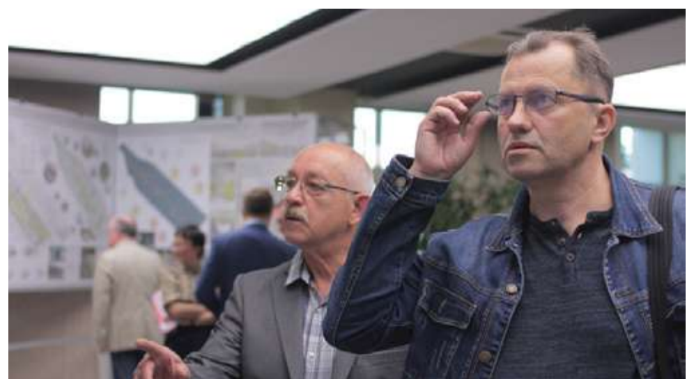
Фото авторов архитектурных проектов