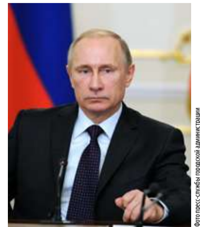
Владимир Путин, президент России

«Еще один очень чувствительный вопрос: при планировании пенсионной реформы правительство исходило из того, что будет положительный финансовый результат в течение нескольких лет от этих мероприятий, но после принятия президентских поправок стало ясно, что не будет никакого дохода от этих мероприятий по изменению пенсионной системы, а наоборот, правительство должно будет профинансировать президентские поправки».