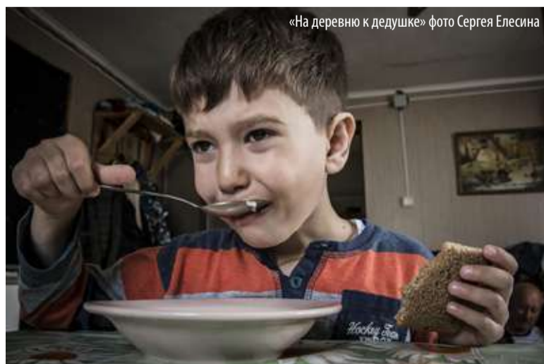
«На деревню к дедушке»

«Процесс творчества какой? Голова тебе подсказывает, что будет дальше. Ты говоришь, допустим: да ну, какая-то фигня. Или заставляешь голову: давай придумывай! А она такая: а я сегодня не хочу. Ты: нет, давай придумывай! Голова: ну на тебе, подойдет? Ты: не совсем. Голова: а вот это? Он, в общем-то, так и протекает, процесс творчества».