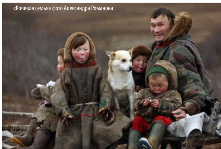
«Кочевая семья»