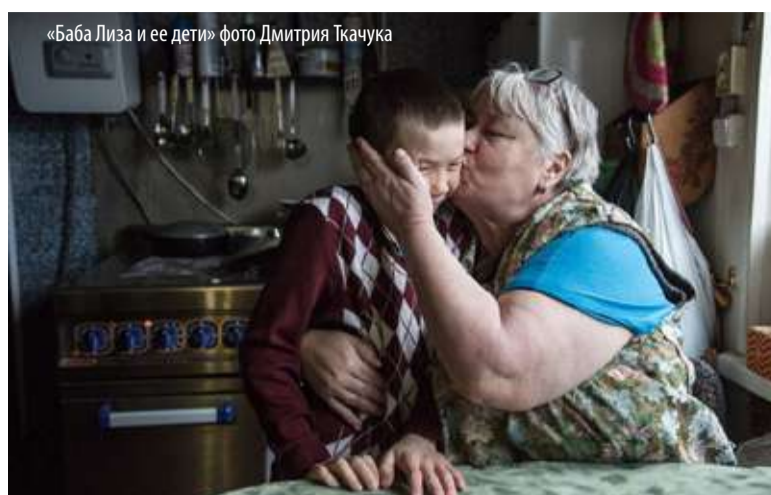
«Баба Лиза и ее дети»