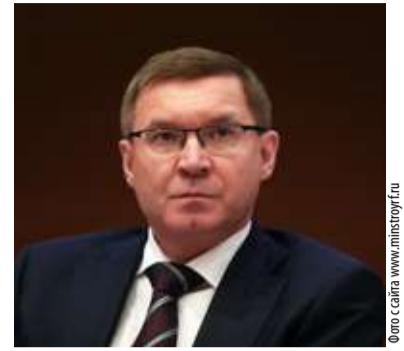
Владимир Якушев , министр строительства и ЖКХ (продолжение темы на стр. 6-7)

«Опыт регионов, в том числе и Тюменской области, успешно разрешивших проблему обманутых дольщиков, будет использоваться для тиражирования в других регионах. В каких-то регионах принимались законы по переходу на бюджетное финансирование, где-то проблемы обманутых дольщиков решались при помощи выделения федеральной земли».