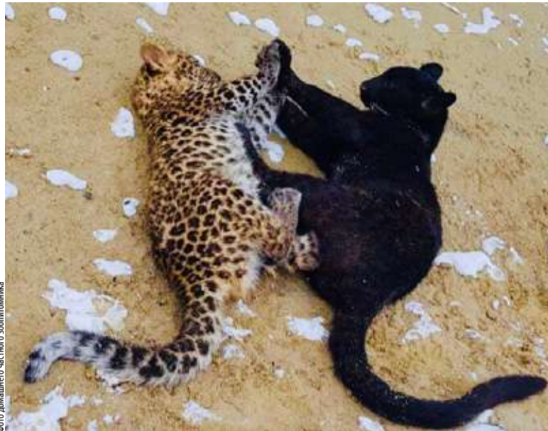
Фото домашнего частного зоопарка «Ишимия»

У тюменской пантеры Багиры, проживающей в питомнике экзотических животных «У Лукоморья», появился новый друг. Это юный леопард по имени Миамур. Он прибыл в Тюмень около месяца назад. Сейчас Миамуру 3,5 месяца, он отлично вписался в окружение и со всеми подружился.